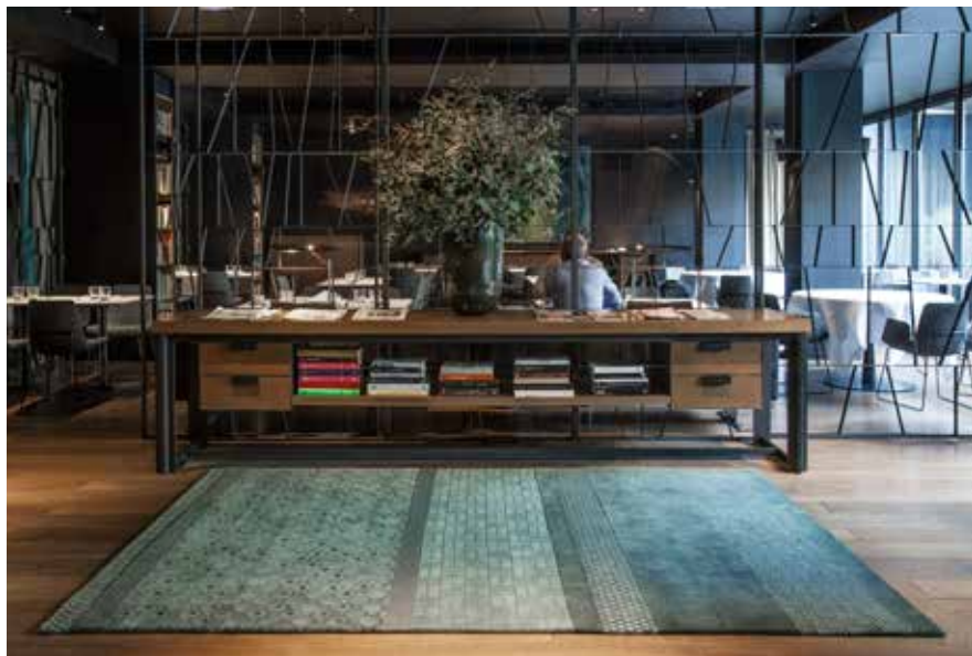
Alma hotel - Barcelona, Spain.