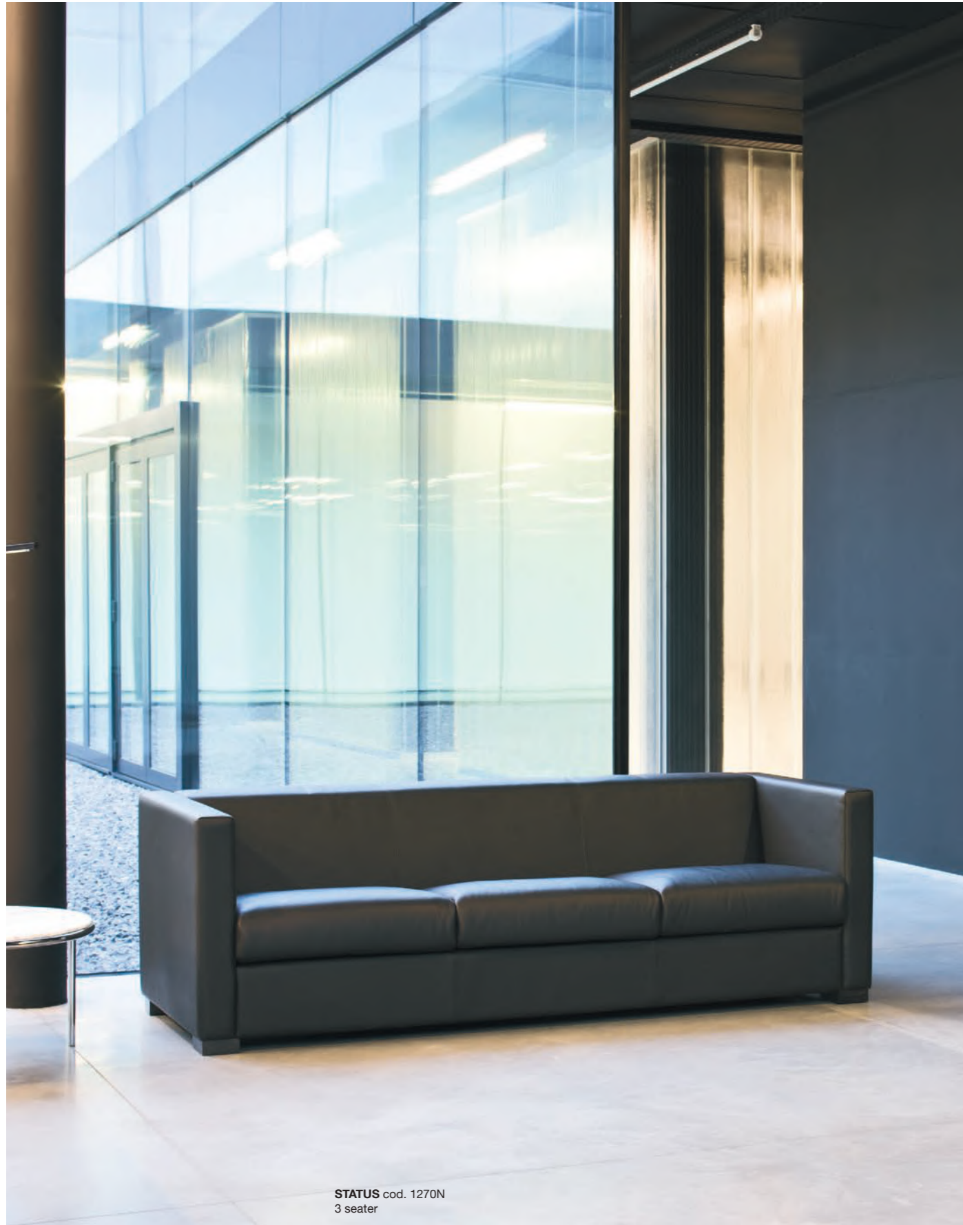
STATUS cod. 1270N 3 seater