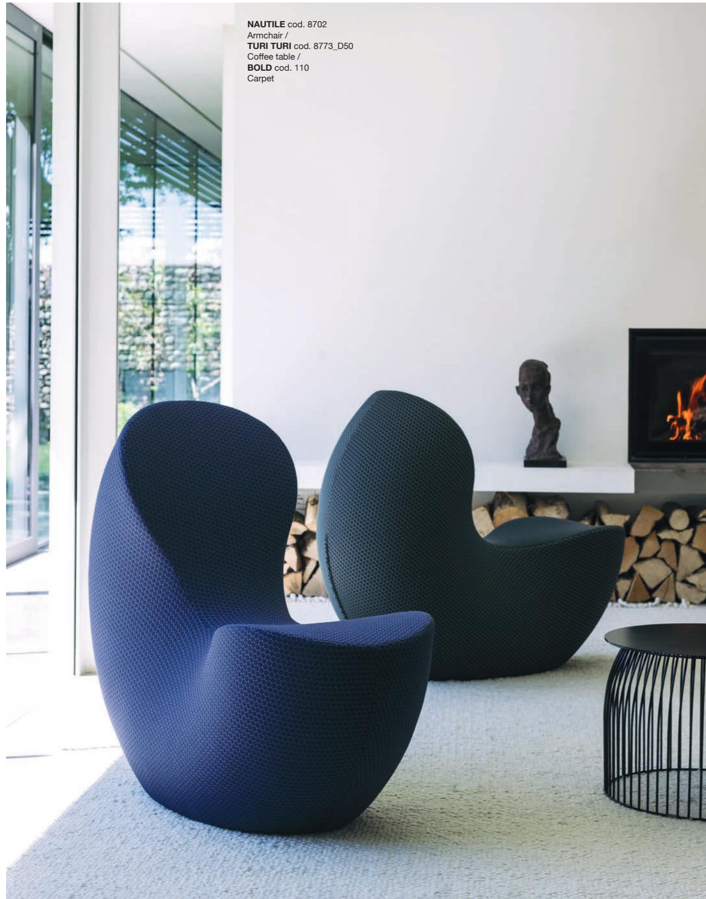
NAUTILE cod. 8702 Armchair / TURI TURI cod. 8773_D50 Coffee table / BOLD cod. 110 Carpet