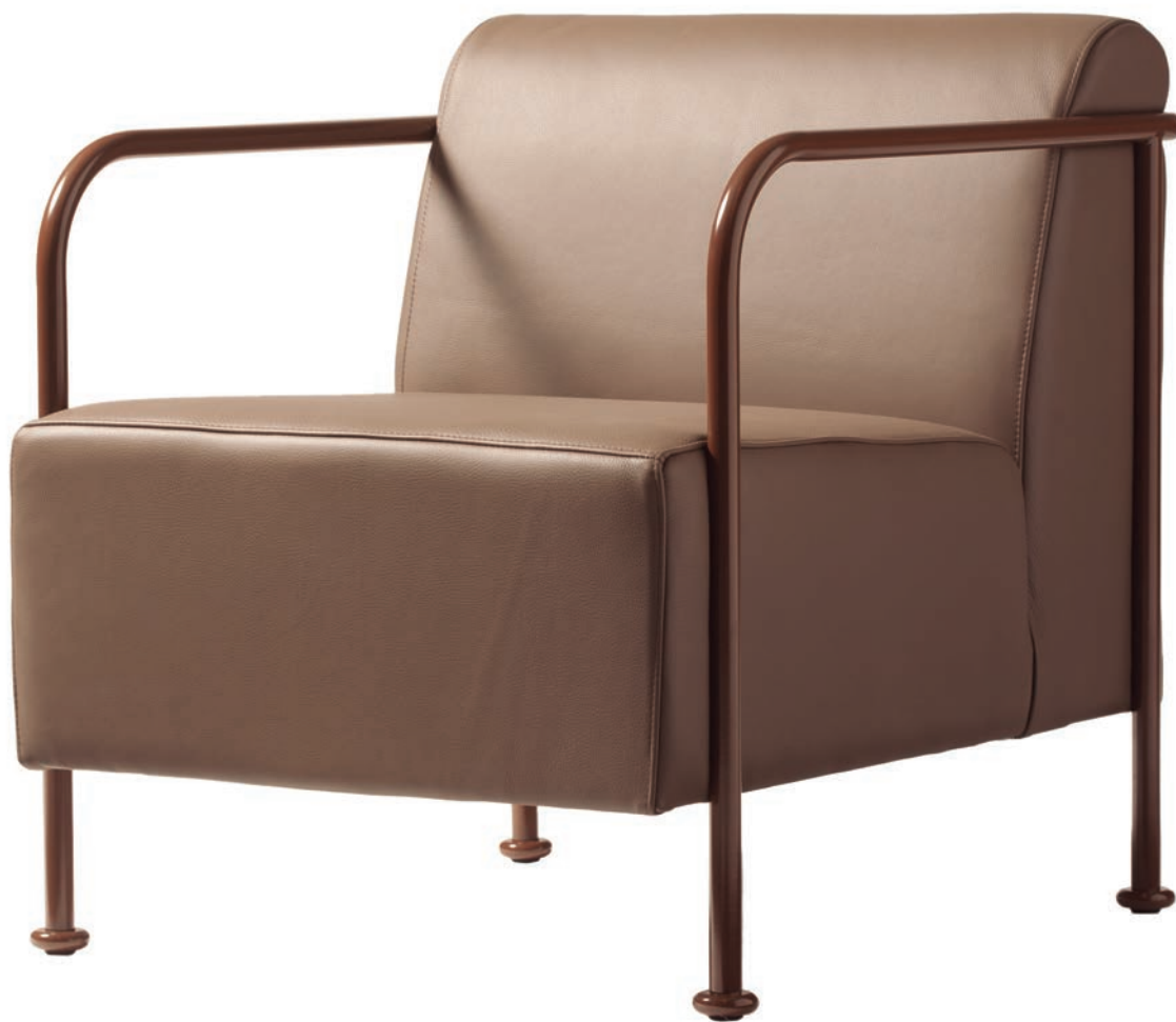
Collection of Lounge chair and sofa.